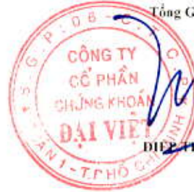
ĐIỂM TRI MINH